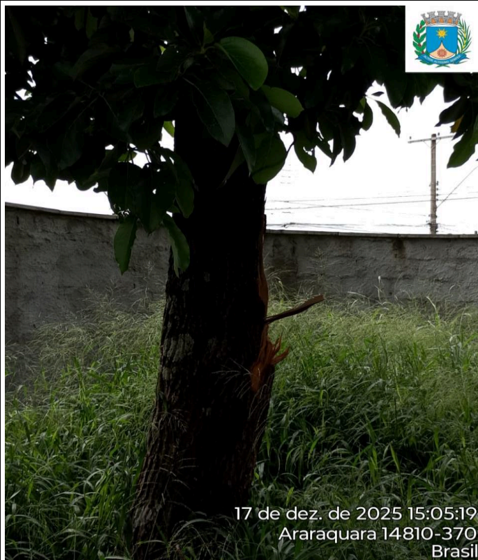
Nº 1. Abacateiro