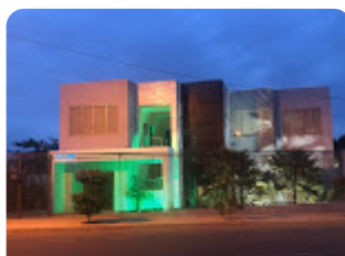
CQI - Central Quími...