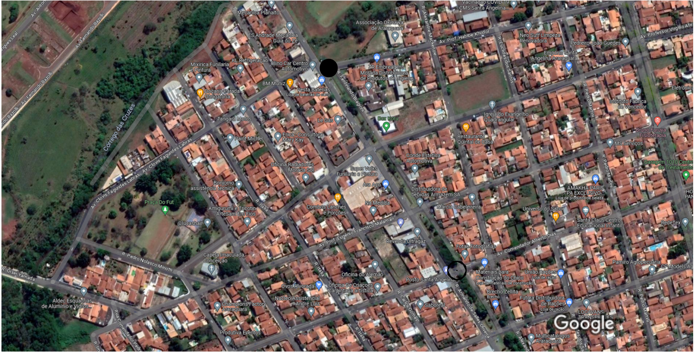
Imagens ©2023 CNES / Airbus, Maxar Technologies, Dados do mapa ©2023 50 m