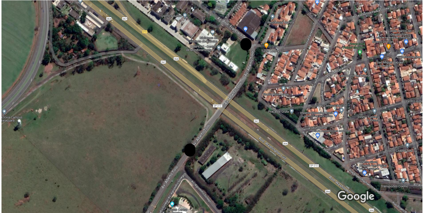
Imagens ©2023 CNES / Airbus, Maxar Technologies, Dados do mapa ©2023 50 m