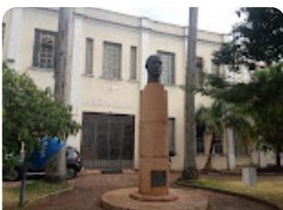
FCF - Faculdade de...