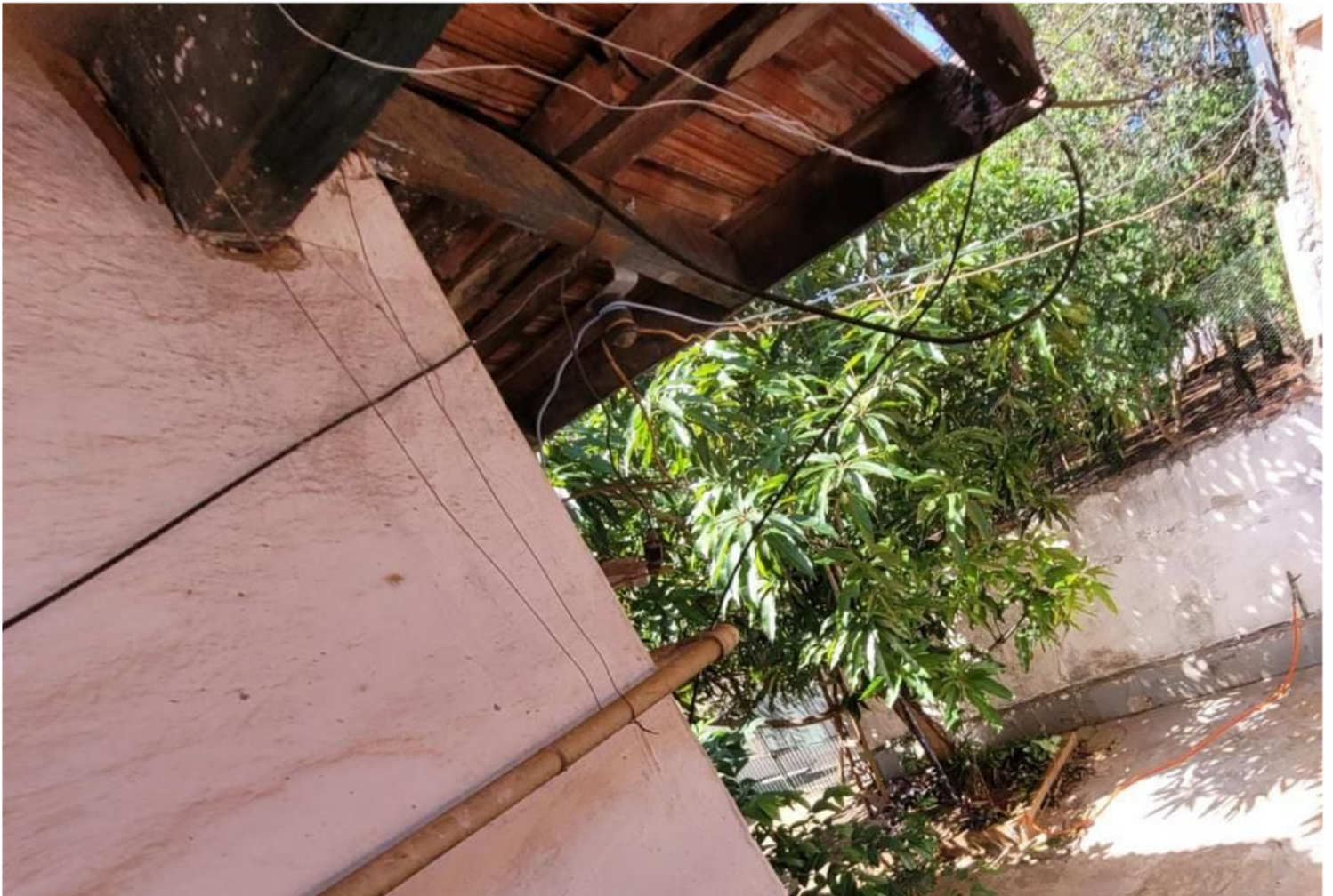
Rua Governador Carlos Frederico Werneck