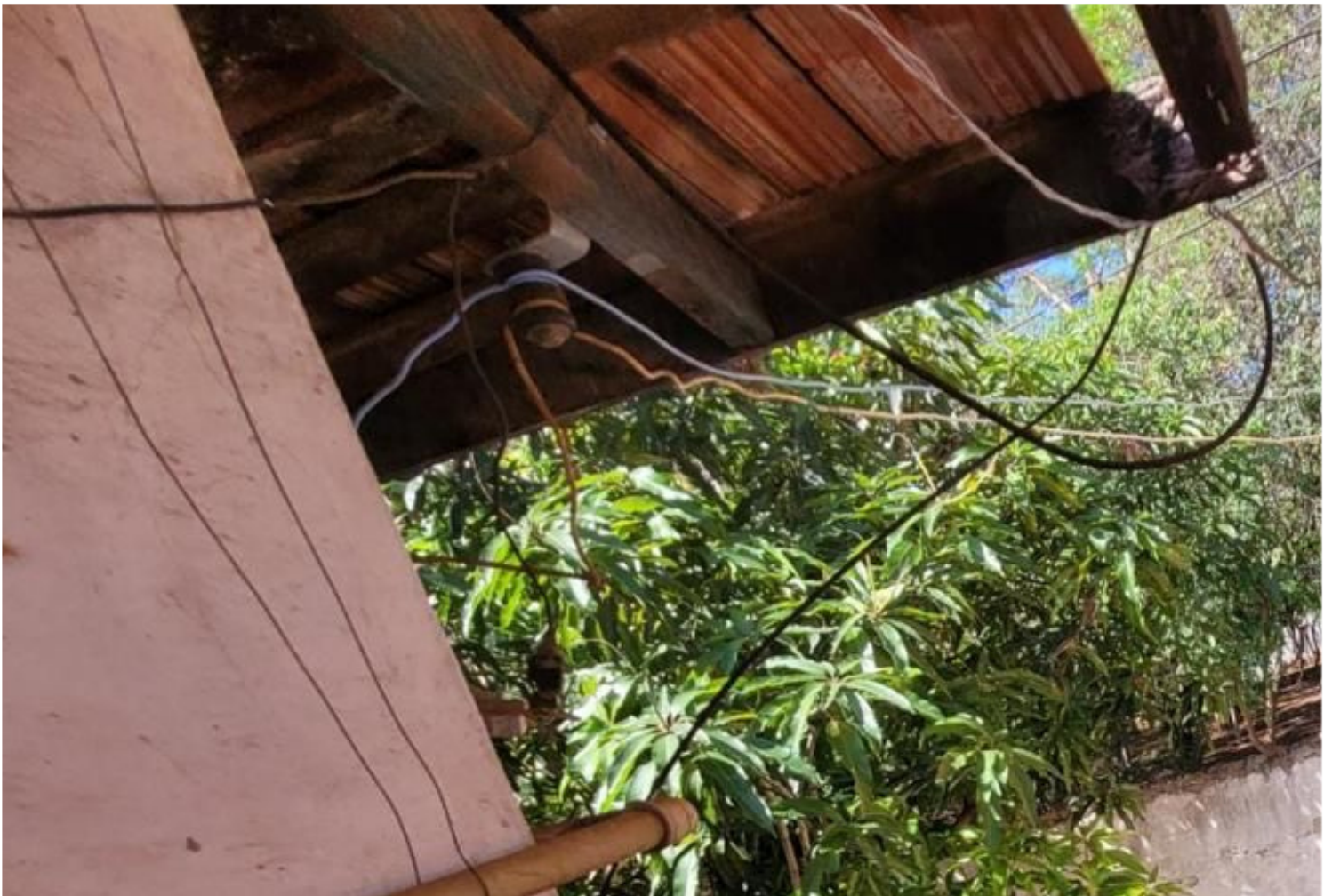
Rua Governador Carlos Frederico Werneck