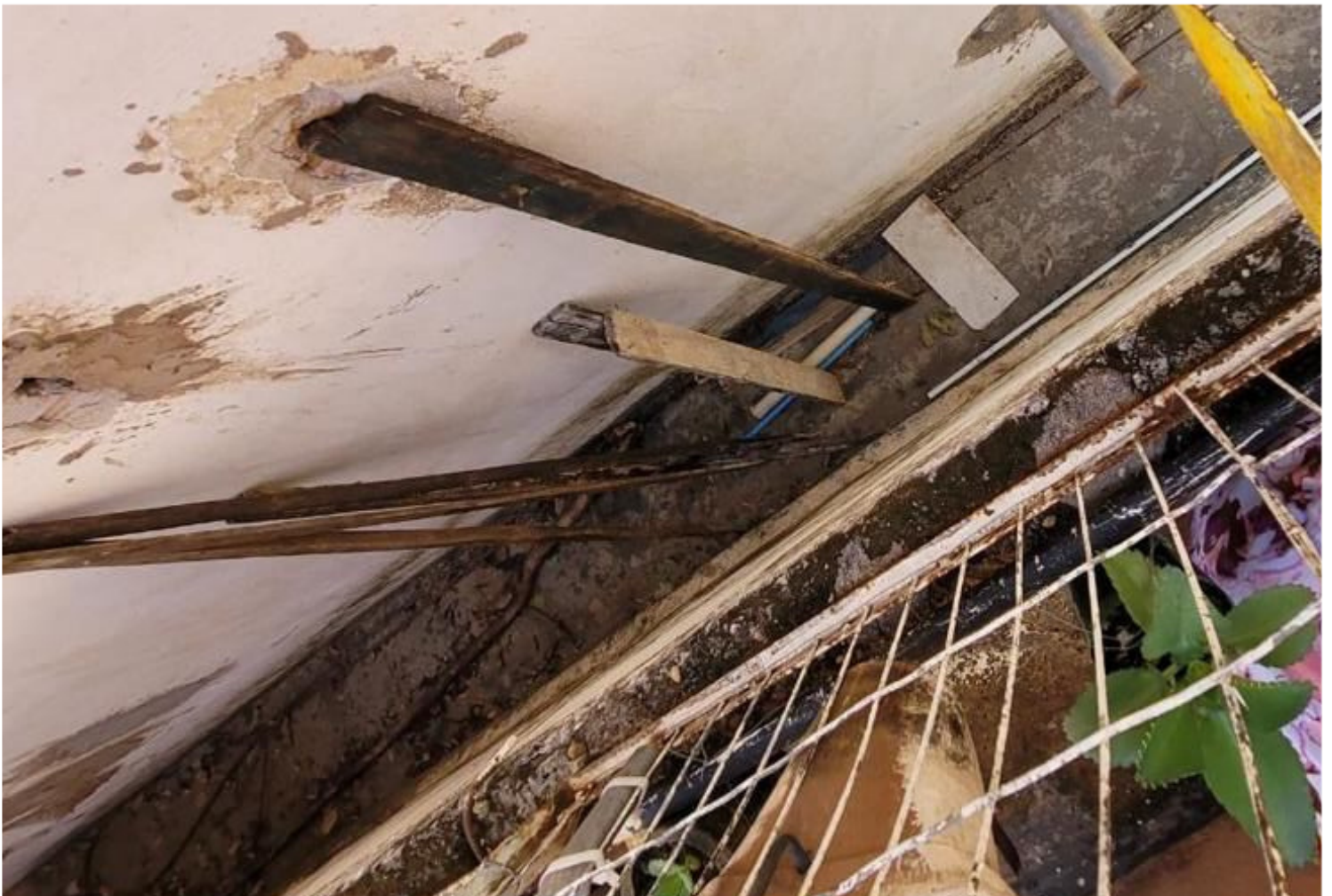
Rua Governador Carlos Frederico Werneck