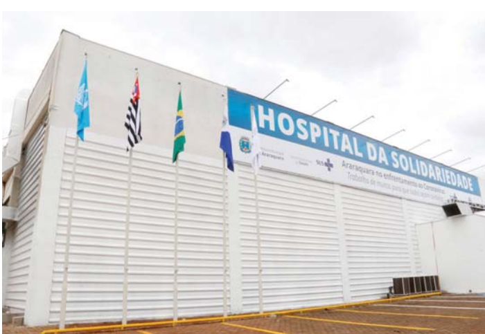
Araraquara tem sido destaque nacional pelas ações que têm tomado no combate ao Coronavírus

No mesmo período, o Brasil realizou 3.227.591 testes para uma população de 212.562.300 habitantes, segundo o Worldometers, site de estatísticas em tempo real. Isso significa que são 1.518 testes a cada 100 mil habitantes. O número é superior também ao registrado pela Coreia do