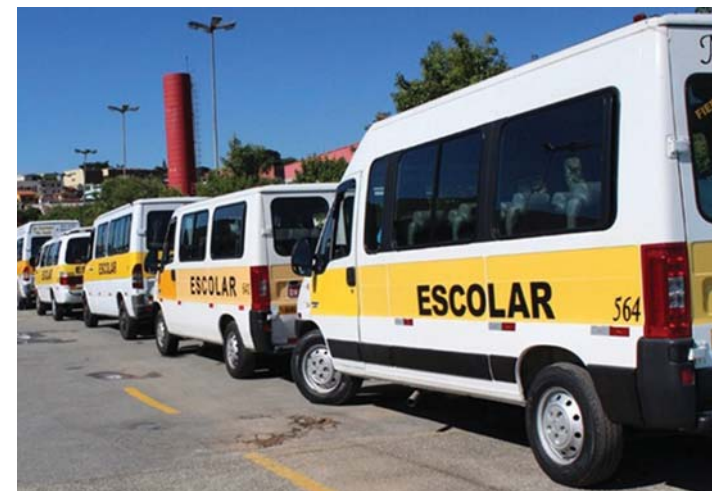
Parecer tem a aprovação da Procuradoria-Geral do Estado; quem já efetuou o recolhimento do tributo poderá solicitar restituição

O governador João Doria solicitou ao Detran.SP a análise e obteve parecer favorável da Procuradoria Geral do Estado (PGE) para suspender a cobrança da taxa de inspeção semestral de veículos escolares, considerando que não houve prestação de serviços devido à suspensão das aulas presenciais nas escolas municipais e estaduais, em razão da pandemia da COVID-19.