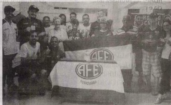
PRÉ-JOGOS NO MUSEU DE REMINISCÊNCIAS ESPORTIVAS "PASCHOAL GONÇALVES DA ROCHA", PONTO DE ENCONTRO DA TORCIDA AFEANA.