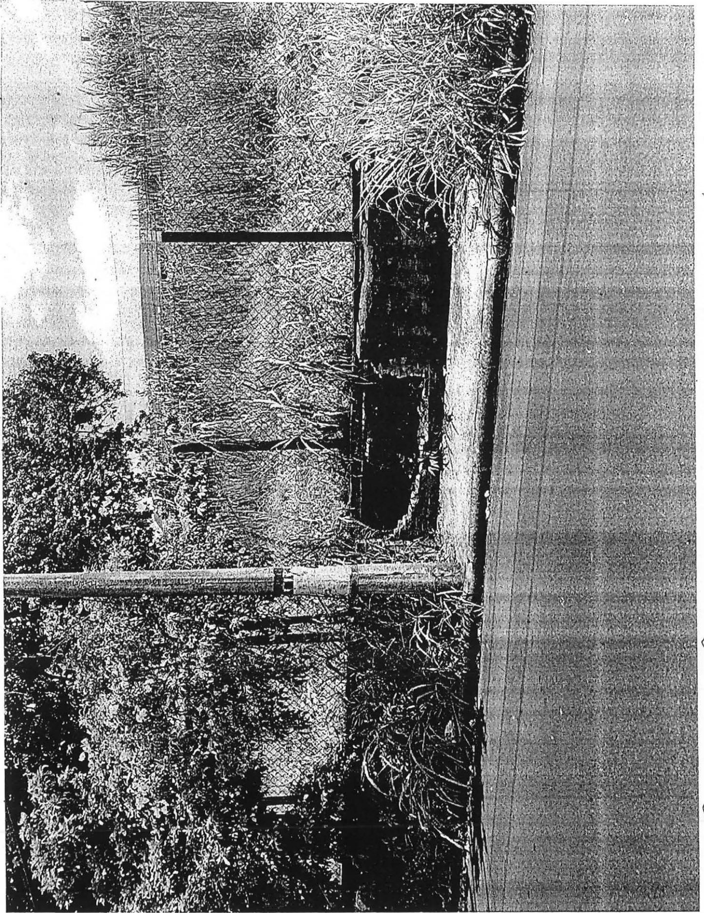
Ponto de Ônibus da Manoel da Nóbrega