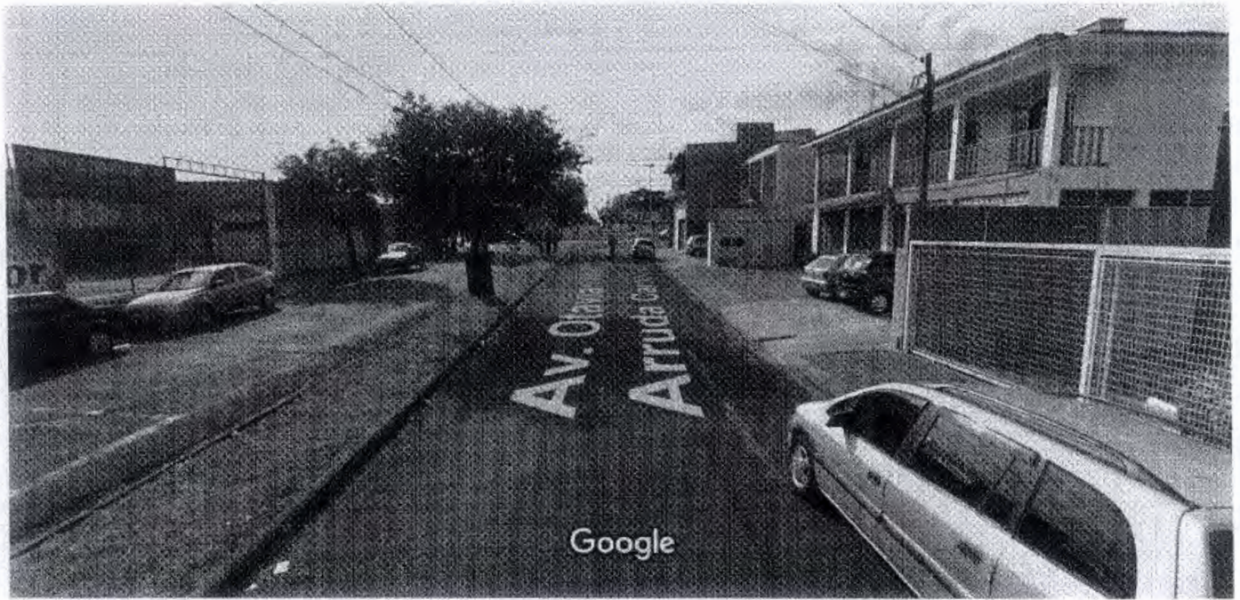
Captura da imagem: ago 2011 © 2019 Google