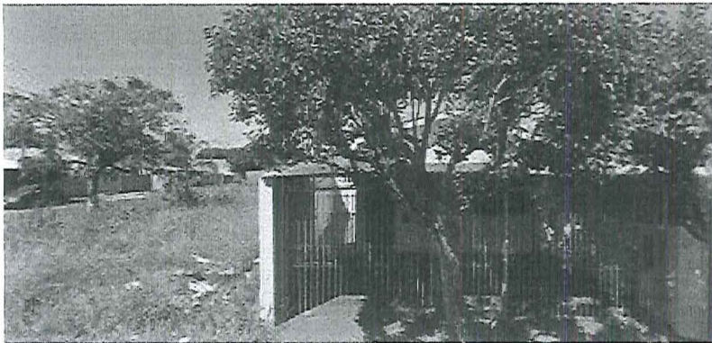
R. Benedito Máximo de Araujo Araraquara - SP