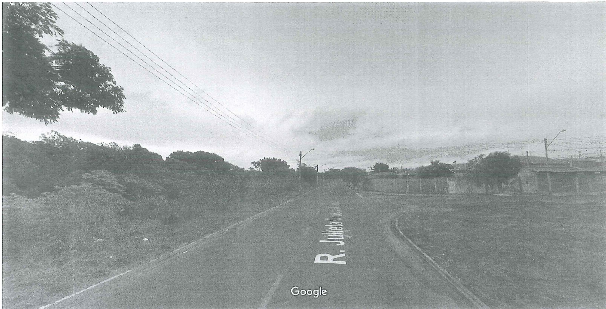
Captura da imagem: ago 2011