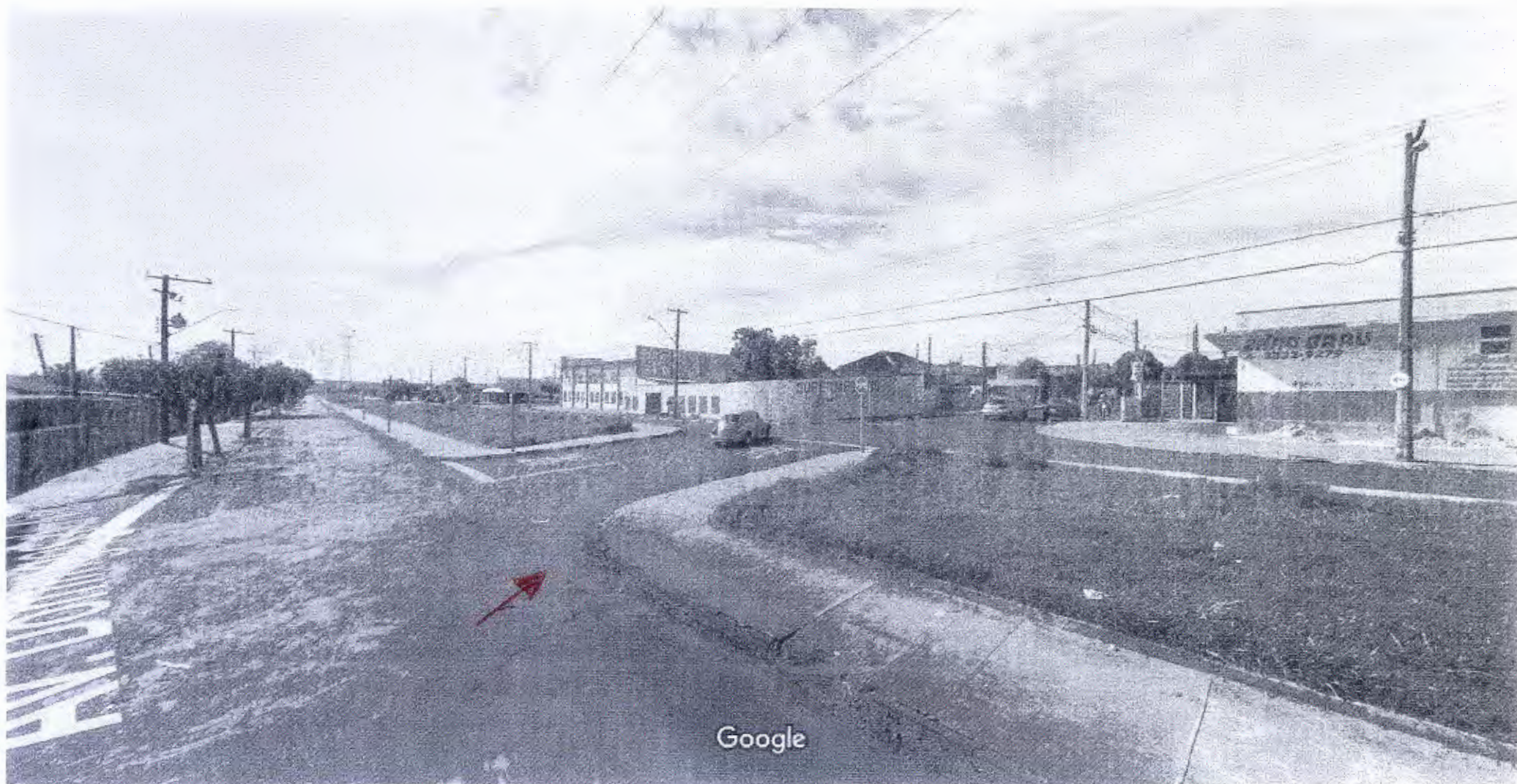
Captura da imagem: jun 2012