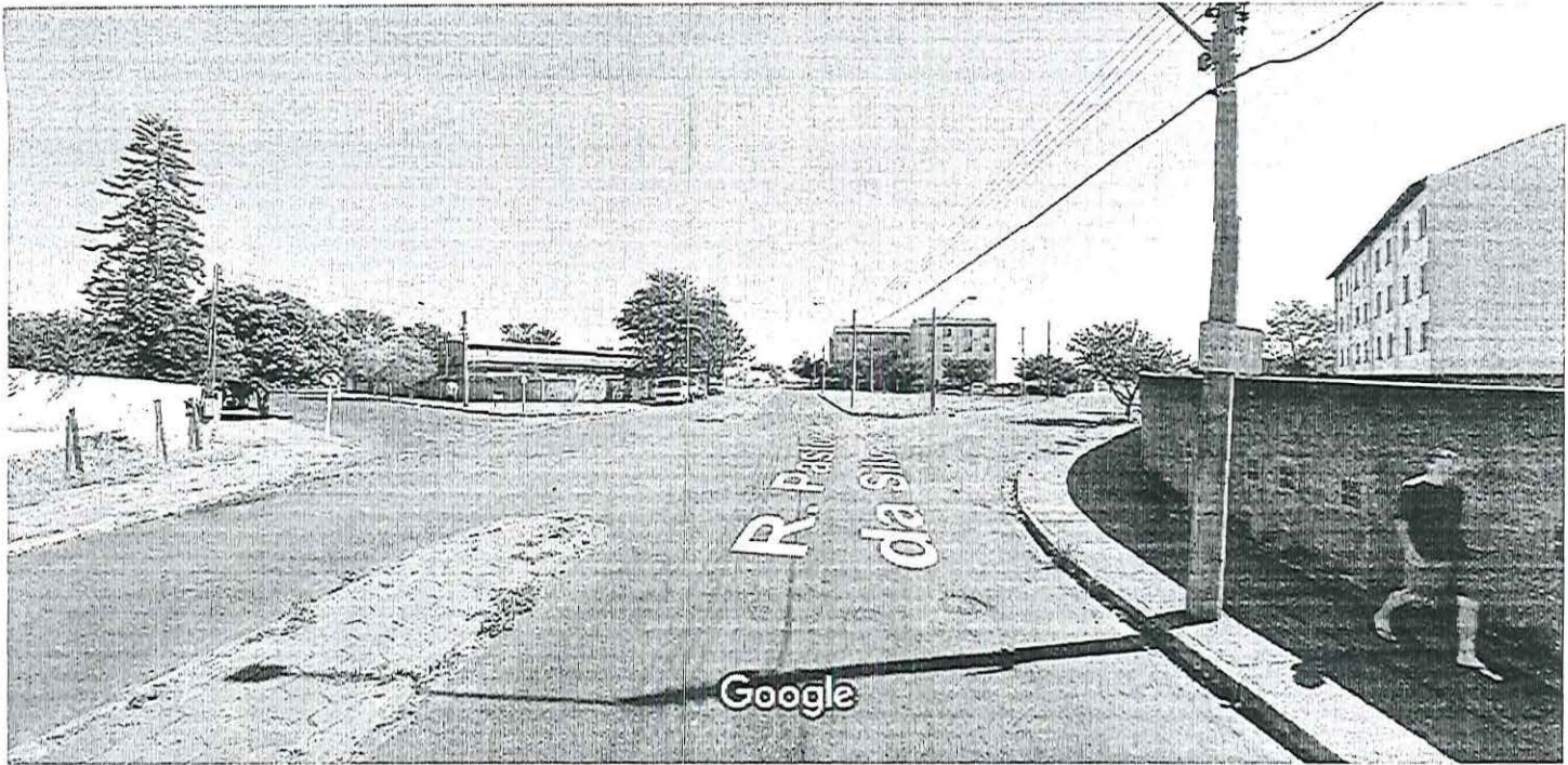
Captura da imagem: ago 2011