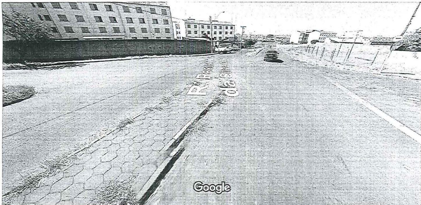
Captura da imagem: ago 2011