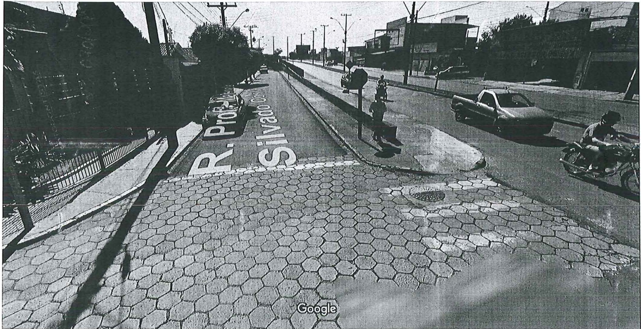
Captura da imagem: jun 2012