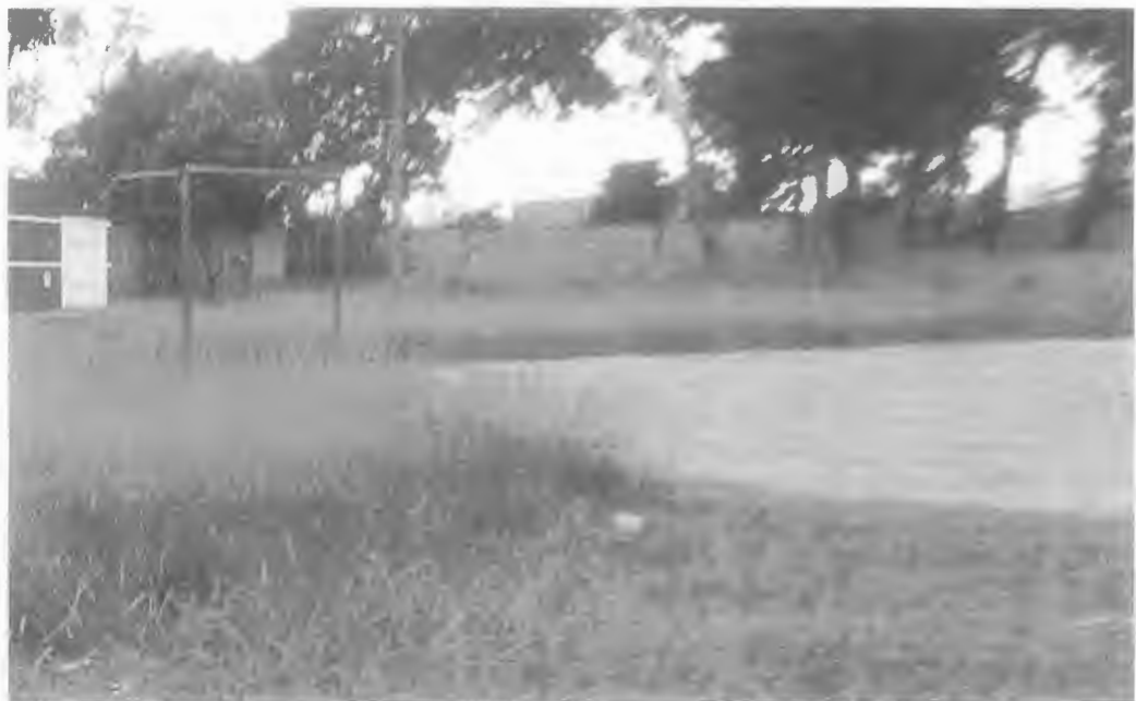
Melhorias e a inclusão de Redes no campo na Rua José Pedro Oliveira.