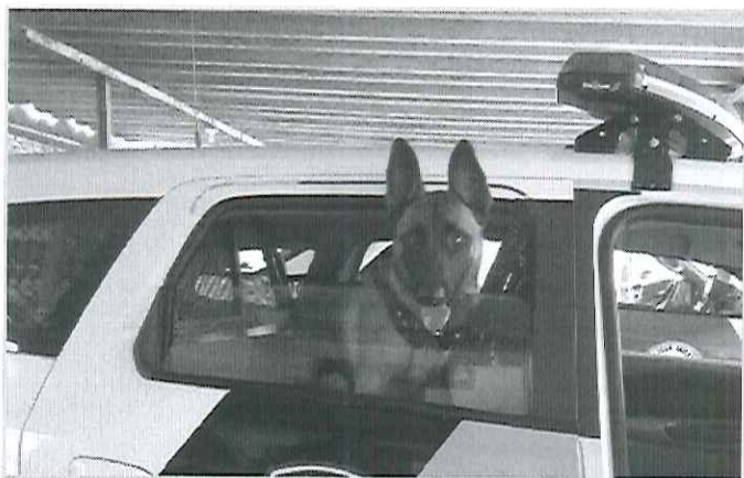
Cão Ares ajuda PM a prender acusado de tráfico

Um jovem de 18 anos foi preso na tarde desta quinta-feira (11) entre as avenidas Alziro Zarur e Rua Carlos Merluzo, no Selmi Dei, em Araraquara. Ele foi abordado pelos policiais e tentou fugir, mas com a ajuda do cão Ares, ele foi cercado.