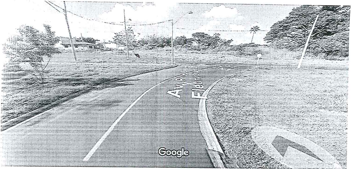
Captura da imagem: jun 2012 © 2017 Google