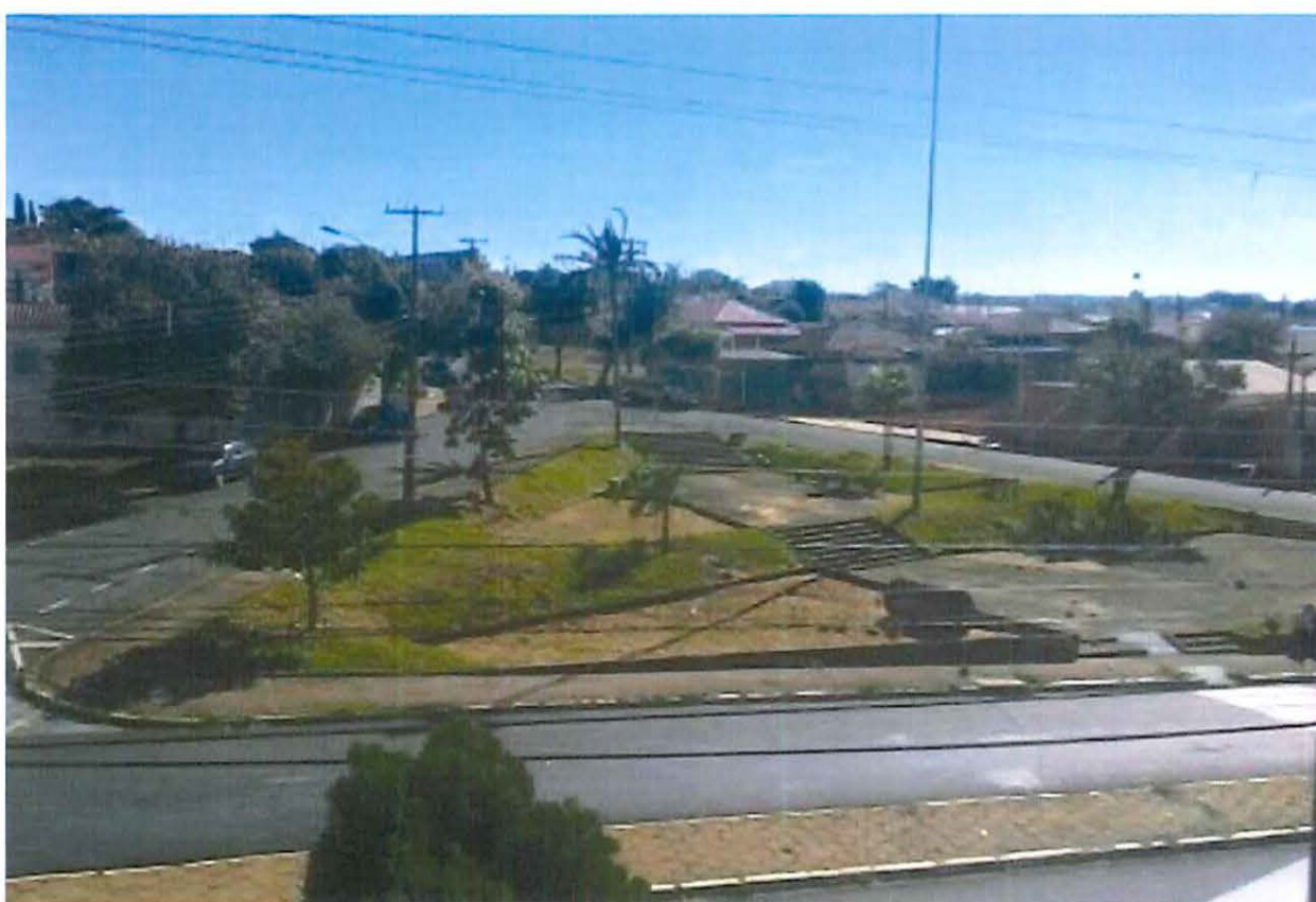
Imagem da praça antes de o casal começar a trabalhar no local

“Estamos lutando, aos pouquinhos para colocar um tabuleiro de damas, amarelinha, um caracol para as crianças. Devagarzinho, chegamos lá”, comenta o pai.