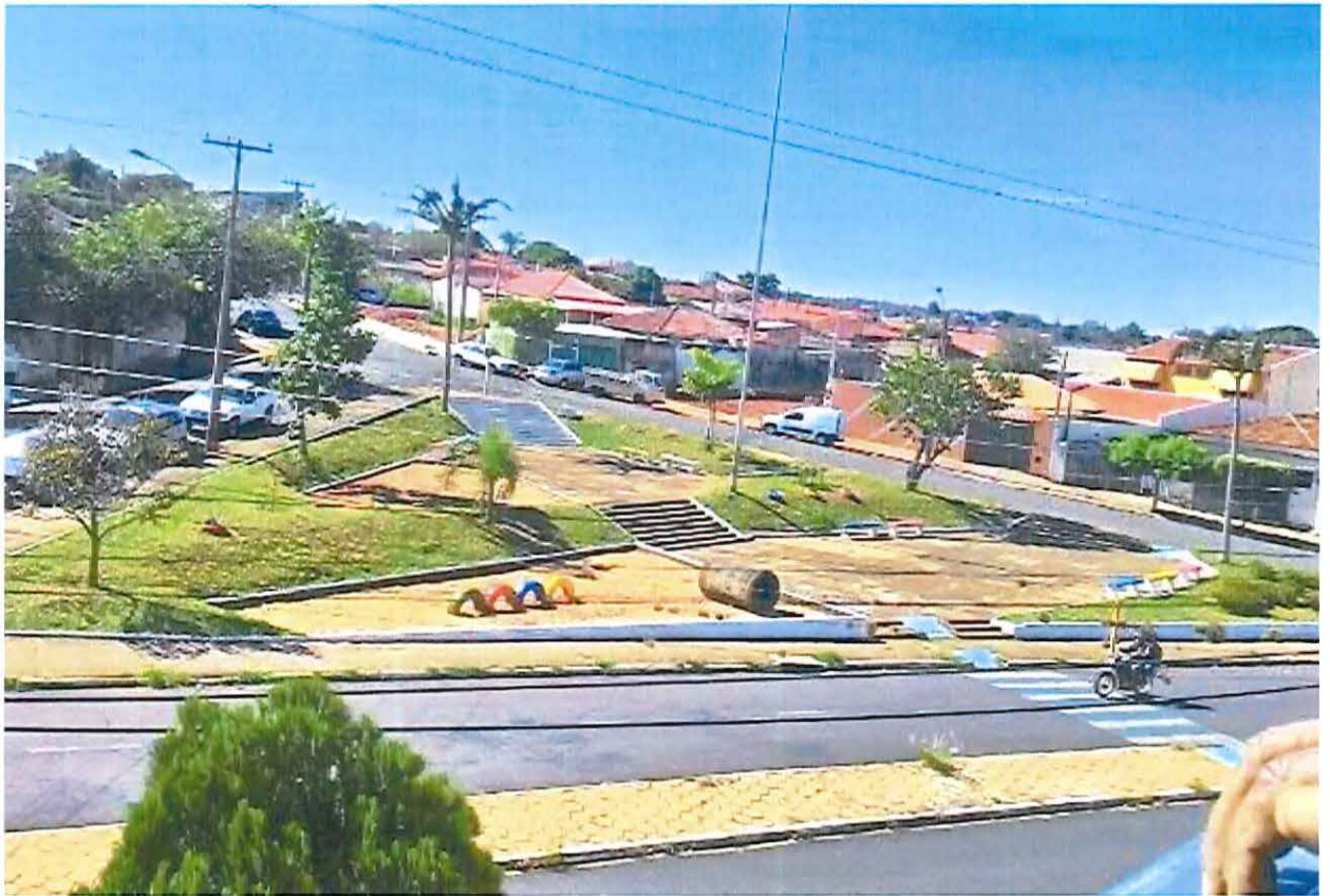
Praça após a intervenção dos pais (Arquivo Pessoal)

A ideia do casal, a partir de agora, é manter a praça bem cuidada e, na medida do possível, desenvolver atrativos para a criançada do bairro. Já há um projeto na Câmara sobre isso. “Queremos organizar um dia de atividades na praça em homenagem a nossa filha”, planejam.