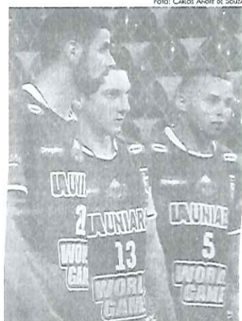
Partida será realizada amanhã, às 20 horas

Para o desafio contra Bauru, a tática será distinta, em relação à utilizada contra o time da capital. "Foram bons os preparativos. Mudamos o ritmo de treinos, pois contra Bauru, precisaremos fazer pressão, atacar e propor mais o jogo, o que é completamente diferente do que necessitávamos fazer contra o Corinthians. Esperamos garantir uma vitória. Está na hora, ou então, vai complicar demais nossa situação no campeonato", finaliza o treinador da equipe de Araraquara.