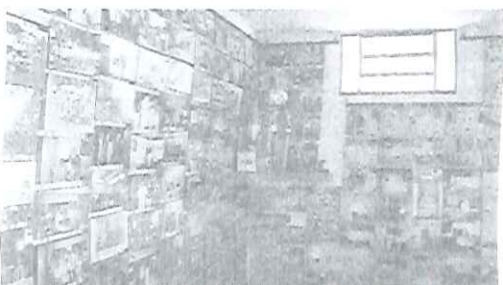
Sala de Reminiscências Esportivas completa 37 anos