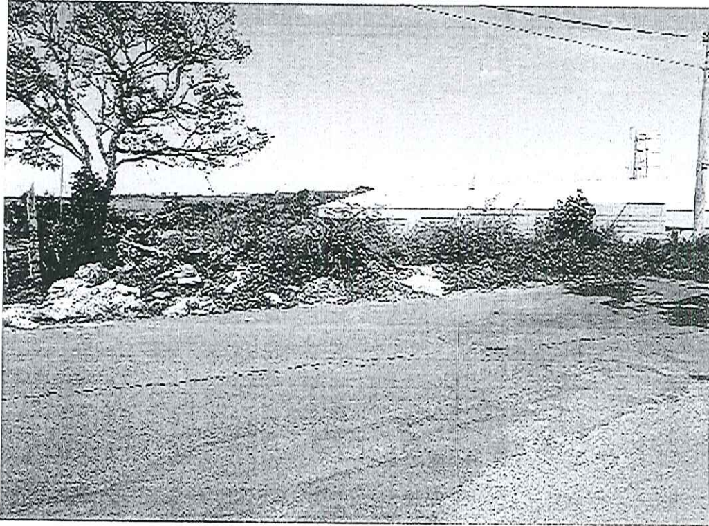
Roçada e limpeza no terreno ao lado do CER Leatrice Rodrigues Affonso.