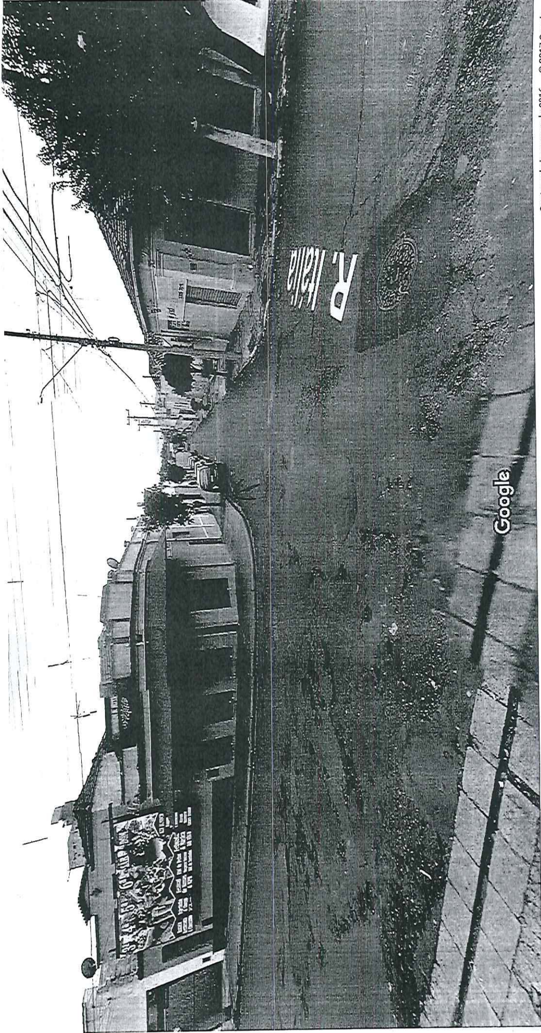
Captura da imagem: abr 2016 © 2017 Google

Araraquara, São Paulo Street View - abr 2016