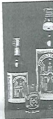
Cachaça que inspirou artistas brasileiros a criarem obras de arte chega a Araraquara

São cinco diferentes rótulos personalizados e úni-