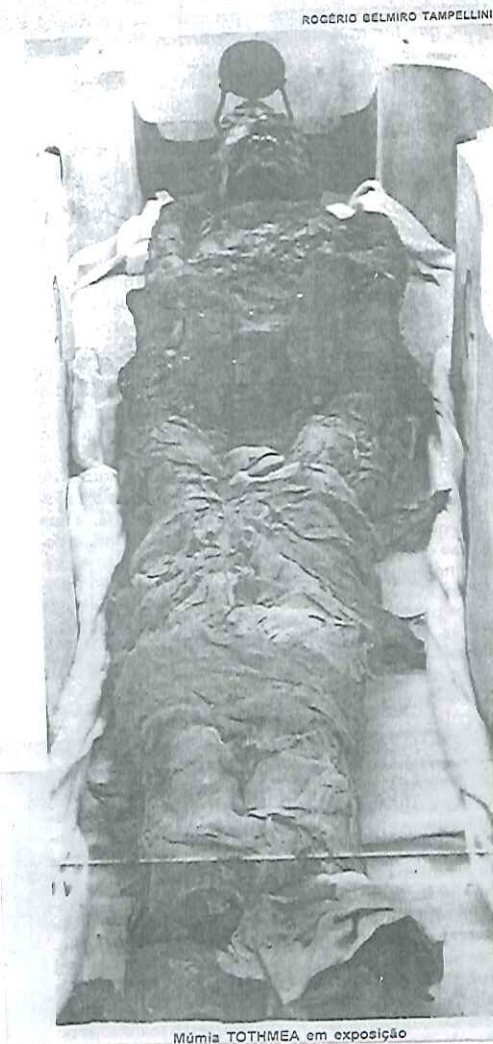
Múmia TOTHMEA em exposição

A Coleção Espírito de Minas Artistas Brasileiros já está disponível em vários pontos de varejo, lojas do comércio das principais capitais como São Paulo, Rio de Janeiro, Bel