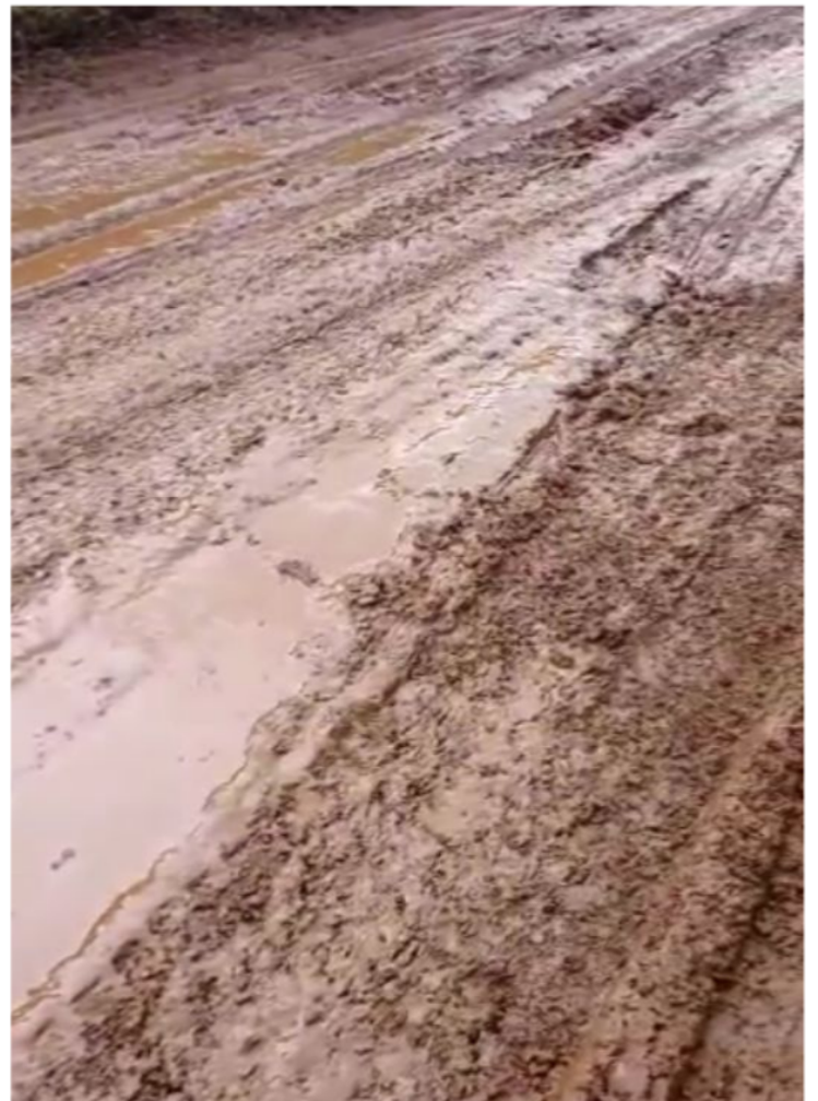
Estrada para o Assentamento Bela Vista do Chibarro