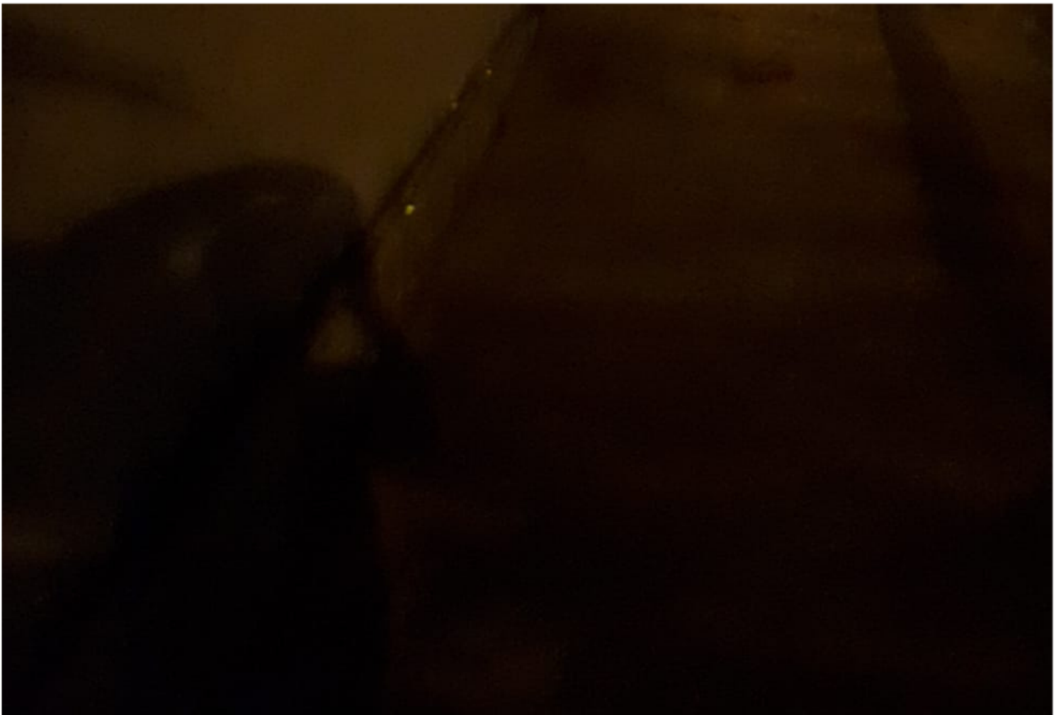
Jardim das Estações