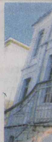
Exposição no no can

As Artes nham repres de e expressã ção virtual d da Arte de A realizada pe de Araraqua da Secretaria da Cultura dart. Com u ção bem ela internautas sear por um do que vem duzido no p as linguager bam as Arte obras e infor dem ser con canal da Pr Araraquara