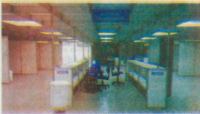
Últimos detalhes das obras de infraestrutura estão sendo concluídos; hospital de campanha terá 30 leitos de enfermaria e 20 de semi-UTI para pacientes com a Covid-19, causada pelo novo coronavírus

Segundo o boletim do Comitê de Contingência do Coronavírus divulgado nesta segunda-feira (4), Araraquara possui 98 casos confirmados da Covid-19, com quatro mortes causadas pela doença, e outras 43 pessoas aguardam resultados de exames. Nos hospitais, 10 pacientes estão internados: oito em enfermaria (dois confirmados e seis suspeitos) e dois