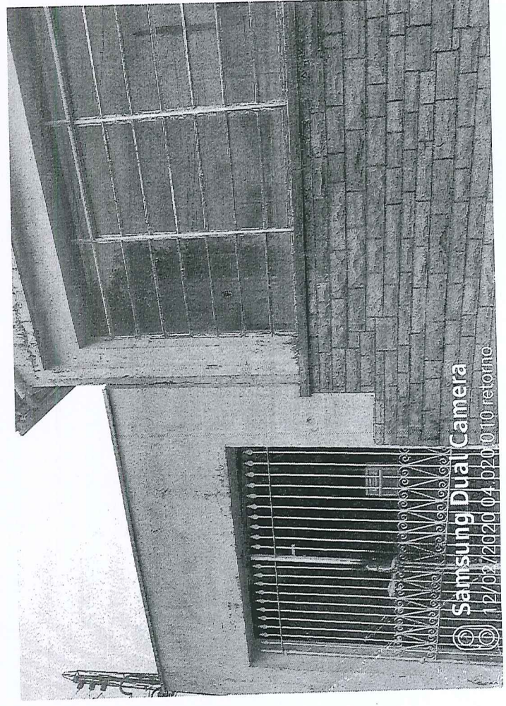
Samsung Dual Camera 12/02/2020 04:020.010 retorno