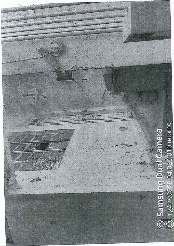
Samsung Dual Camera 12/02/2020 04:020.010 retorno