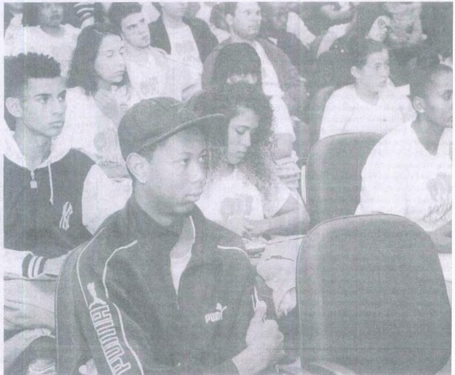
Aula inaugural do Programa Jovem Cidadão

O “Bolsa Cidadania” tem atuação semelhante, mas visa dar socorro imediato às famílias que, muitas vezes, não têm o que comer. São três eixos principais: segurança alimentar e nutricional, qualificação profissional, além do acompanhamento familiar nas áreas de Assistência Social, Saúde e Educação.