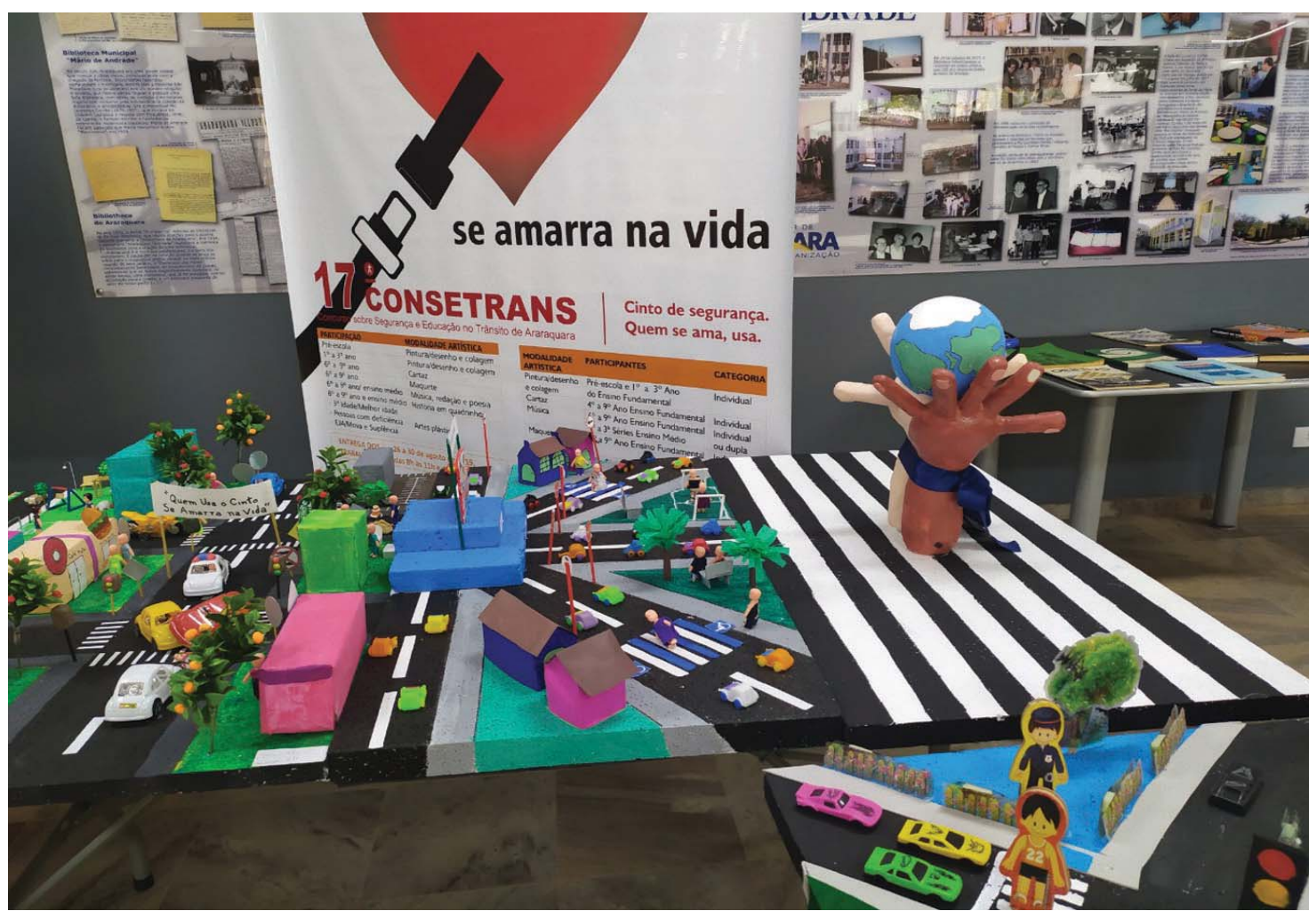
A premiação do Concurso sobre Segurança e Educação no Trânsito de Araraquara ocorre no próximo dia 24, no Cear

ÔNIBUS PASSAM A TER ADESIVOS SOBRE A LEI QUE PROÍBE O CONSUMO E BEBIDAS ALCOÓLICAS NO INTERIOR DE VEÍCULOS