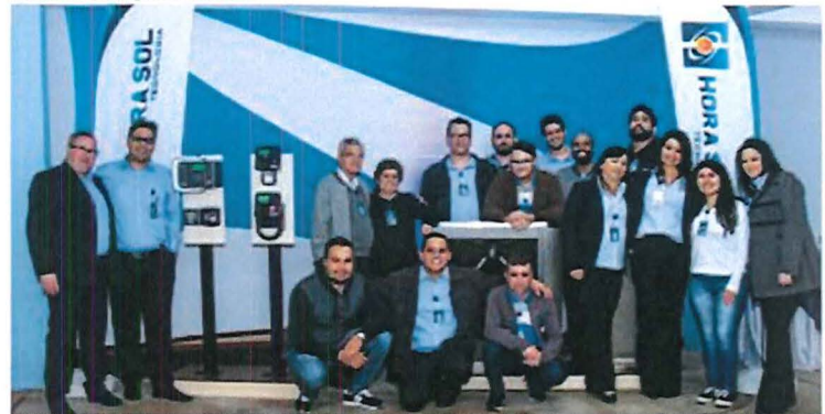
Equipe de colaboradores da Hora Sol durante a realização do evento, que se transformou em momentos de reflexão sobre a trajetória percorrida pela empresa desde 1971, quando ela foi criada