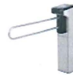
Catraca de acesso a cadeirante