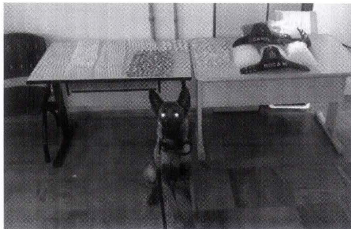
Entorpecente foi apreendido no Hortênsias com a ajuda do cão Mauus

Equipes do Canil da Polícia Militar encontraram entorpecentes na mata que fica às margens da Rua Synésio Wyss Barreto, entrada para o Jardim das Hortênsias, em Araraquara, na tarde da última segunda-feira (1).