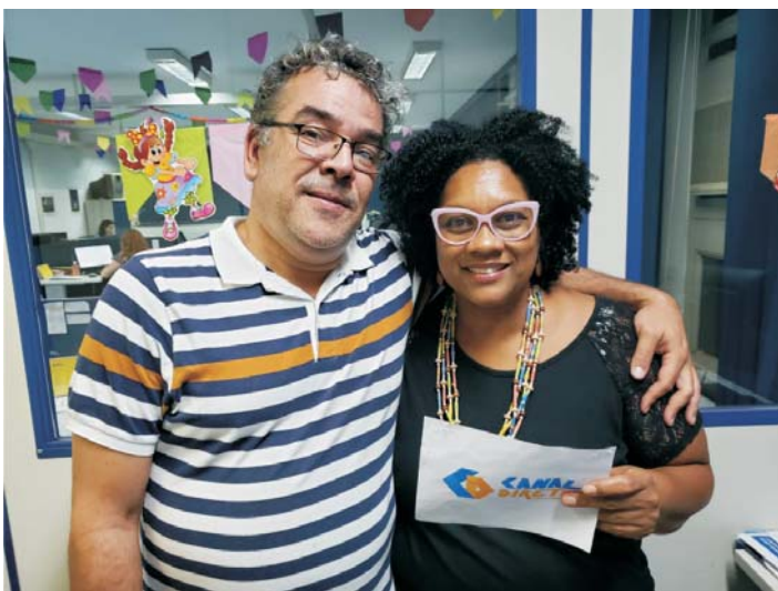
População de Araraquara pode votar no site da Prefeitura até as 23h59 de 5 de julho