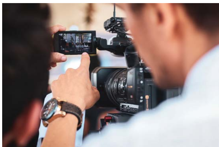
Segundo bloco de concursos inclui linhas nas áreas de audiovisual, museus, espaços culturais, leitura e escrita e cultura popular, tradicional e diversidade, totalizando R$ 20,7 milhões

"É o maior programa de fomento à arte e à cultura do Brasil em nível estadual, o que demonstra o compromisso do governador João Dó-