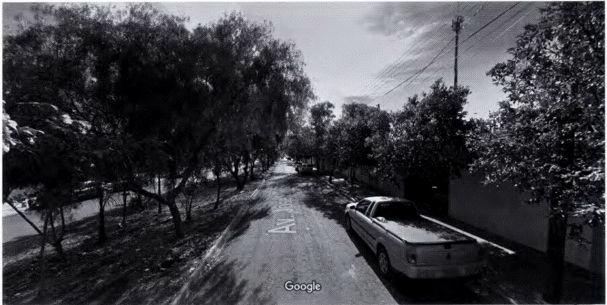
Captura da imagem: ago 2011