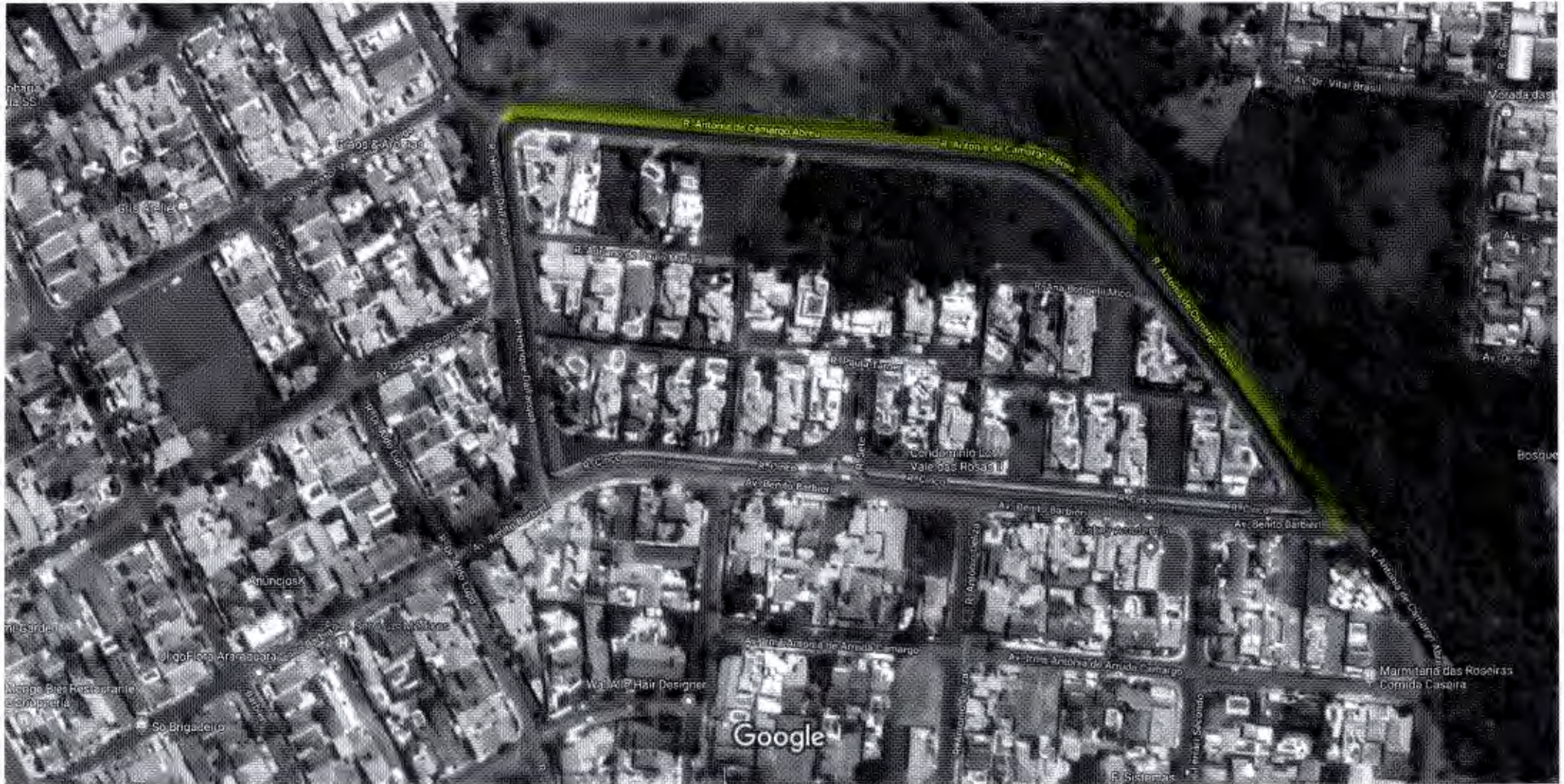
50 m