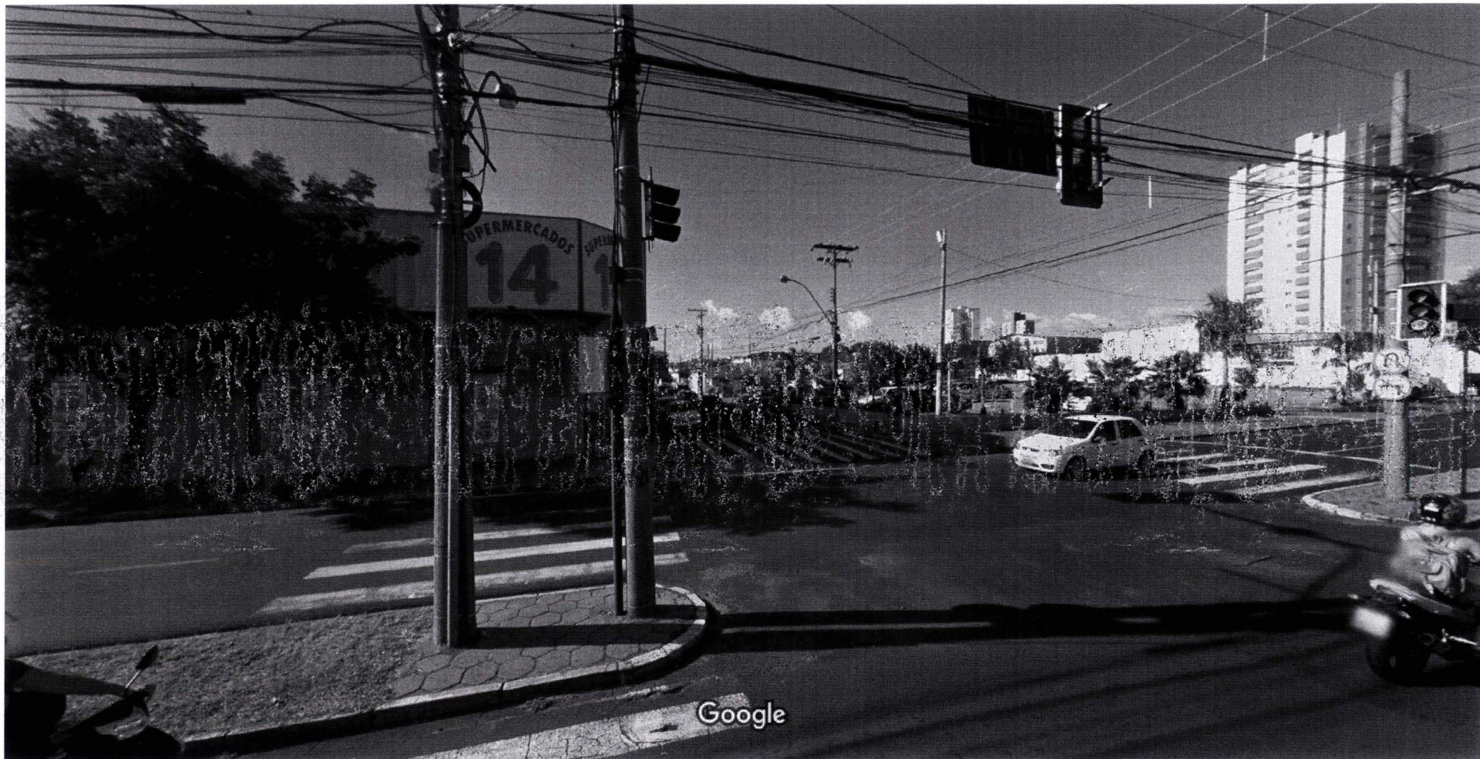
Captura da imagem: fev 2017