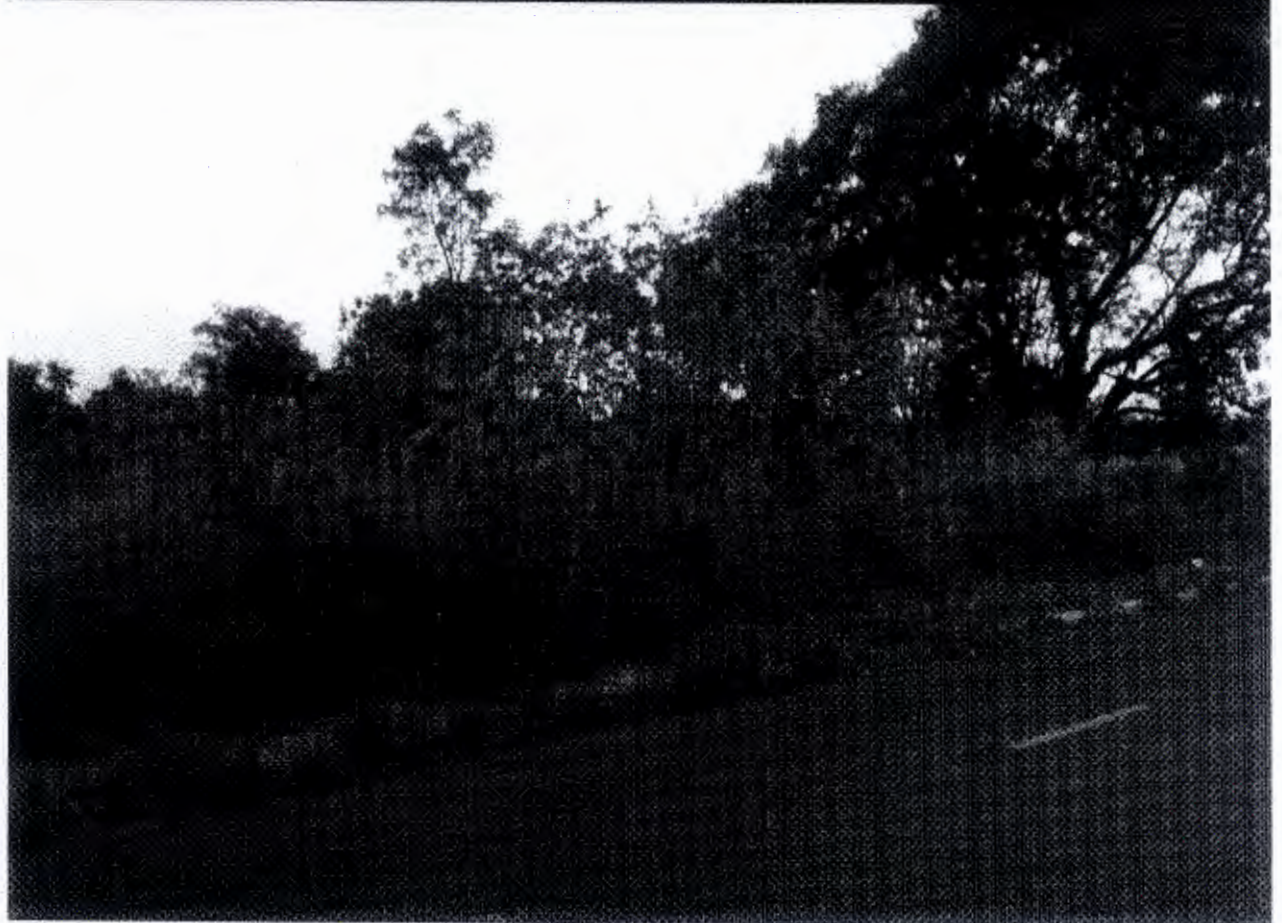
Indicação 028 - 02 - Terreno Jd Brasilia