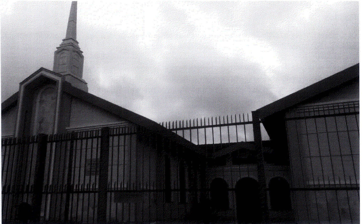
Homem esfaqueia fiéis na Igreja Jesus Cristo dos Últimos Dias, em Aparecida de Goiânia