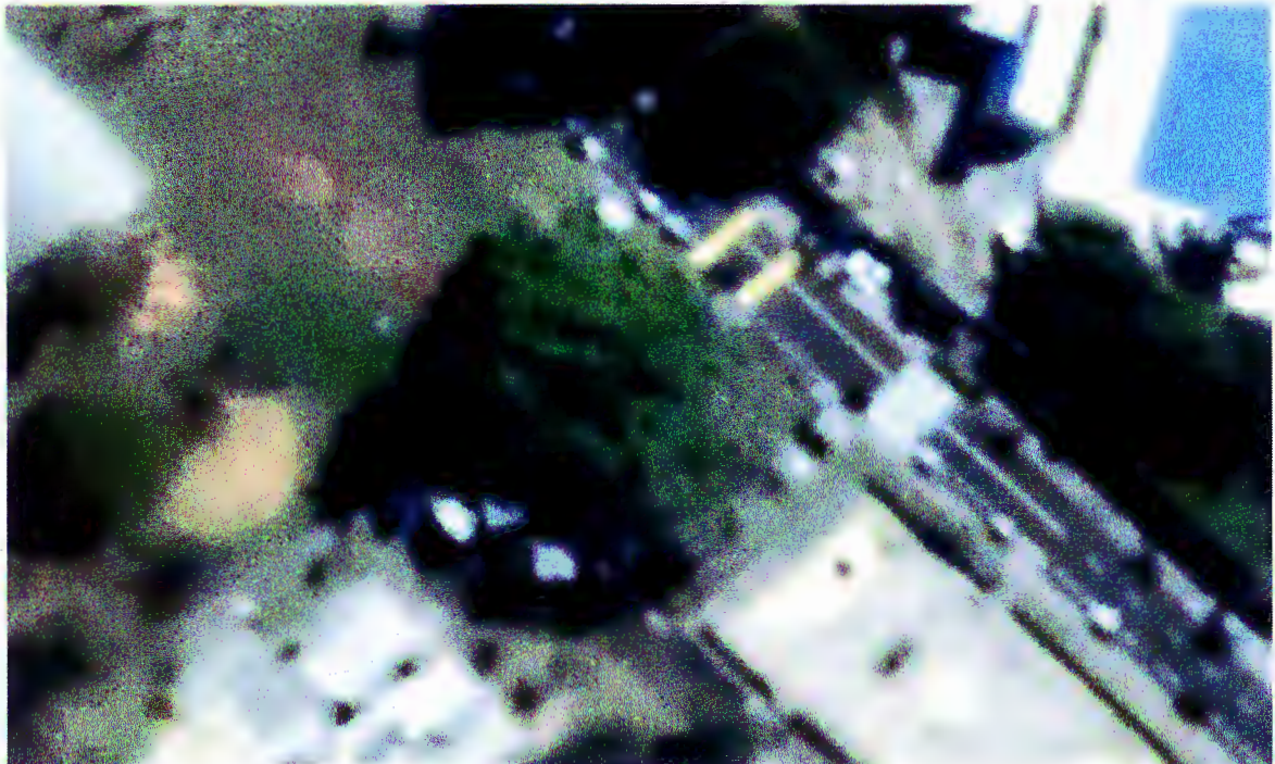
Copa das árvores em Maio/2017