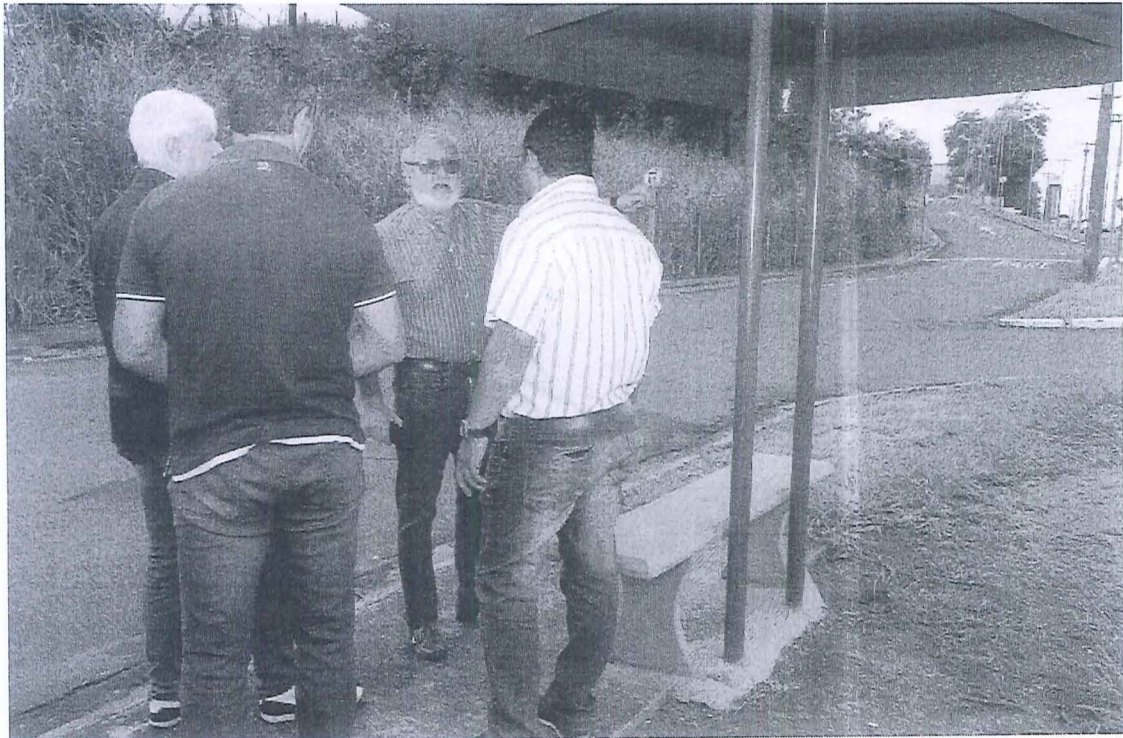
Foto 03: A distância a ser percorrida hoje, entre o ponto de ônibus à UPA;