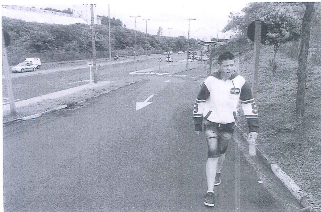
Foto 01 e 02: Hoje o paciente terá que subir esta rampa sem calçamento;