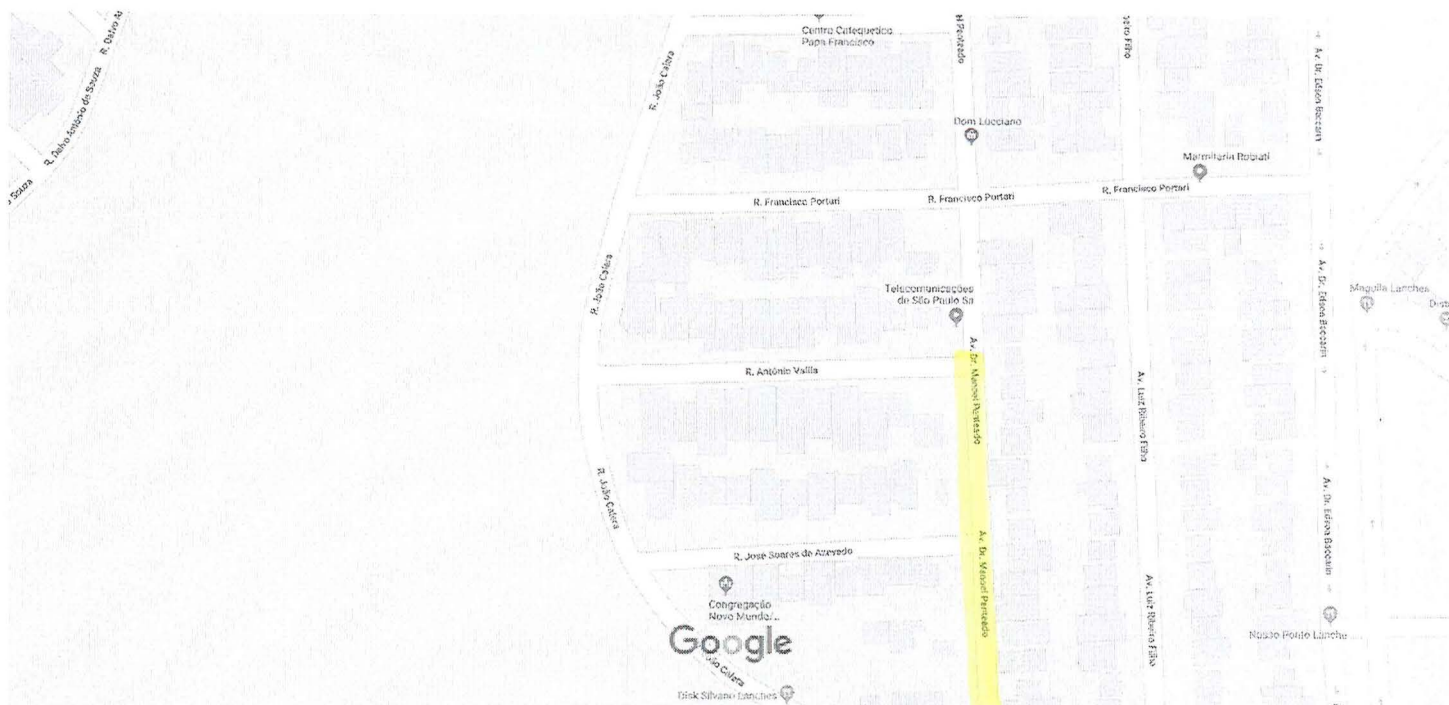
20 m