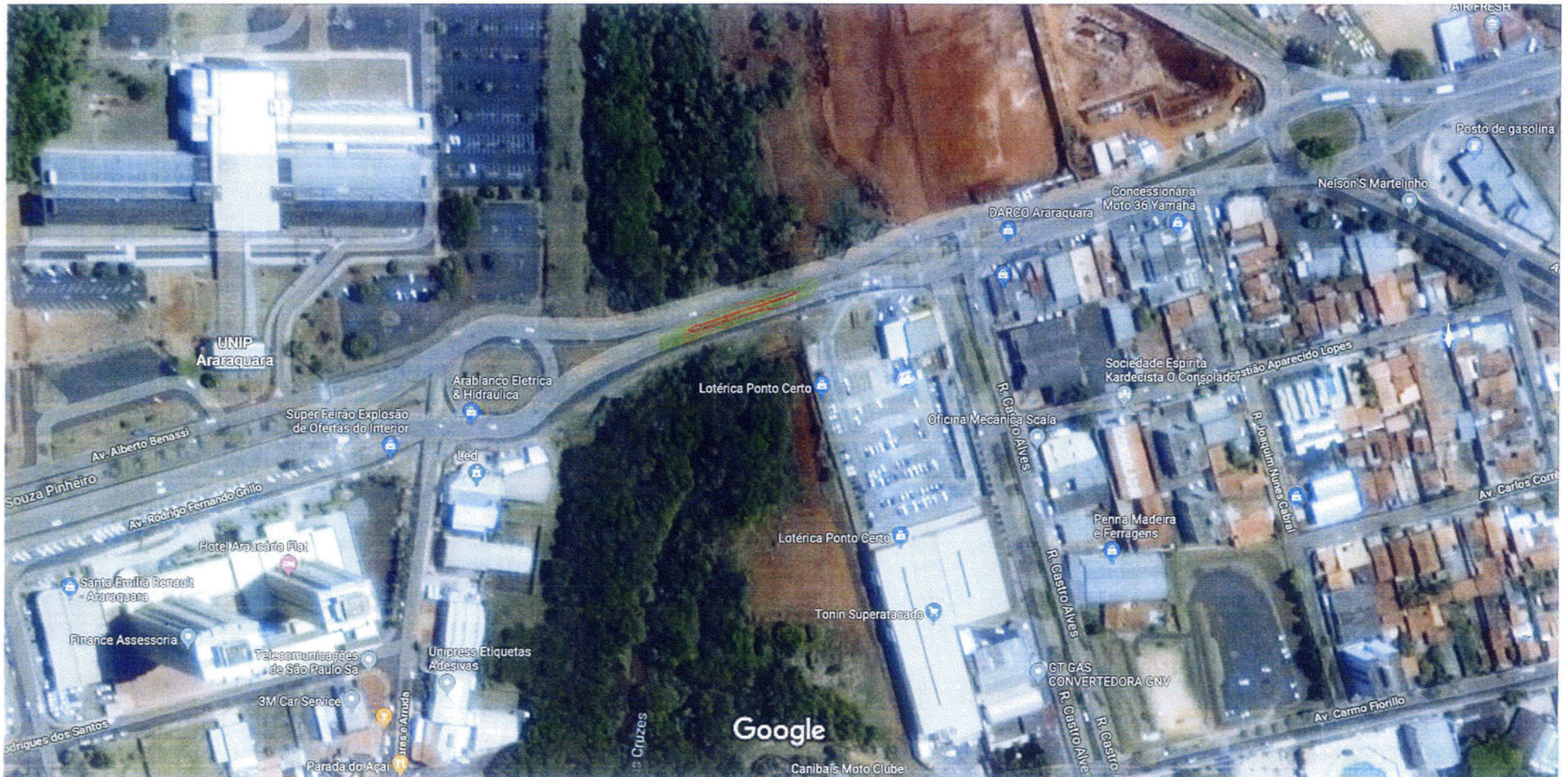
Imagens ©2018 DigitalGlobe, Dados do mapa ©2018 Google 20 m