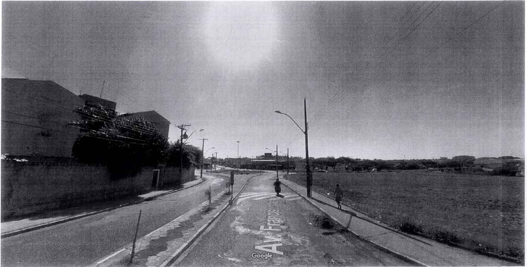
Captura da imagem: jun 2012 ©2018 Google