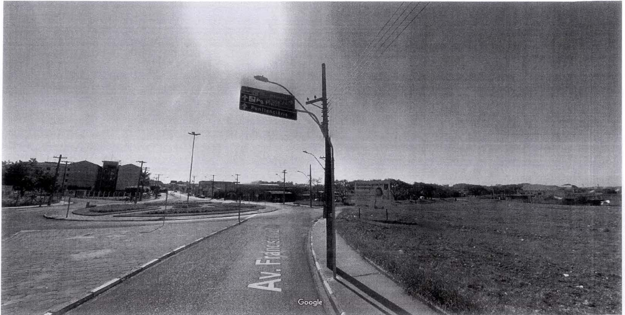
Captura da imagem: jun 2012