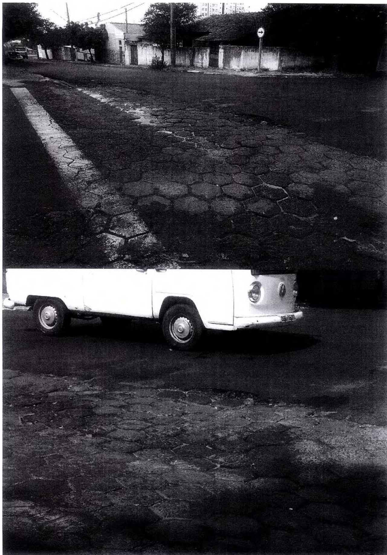
Ind. 006 - 08 – tapa-buraco são José