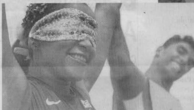
Cena do curta "A Valsa do Pódio"

Nesta edição do festival de Nice, foram selecionados 308 filmes em competição divididos em seis categorias (Clípe esportivo, Longa-metragem de ficção, Esporte e Sociedade, Documentário Esportivo, Jogos Olímpicos e Prêmio Especial do júri). A seleção desses filmes se deu em duas etapas: de início, foram chamados estudantes