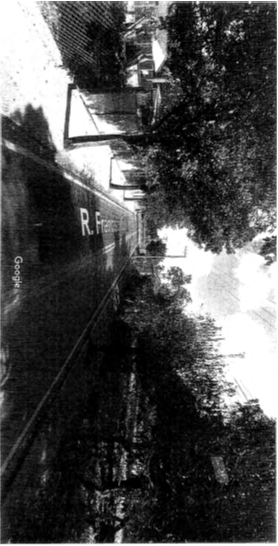
Captura da Imagem: Jun 2012 © 2018 Google