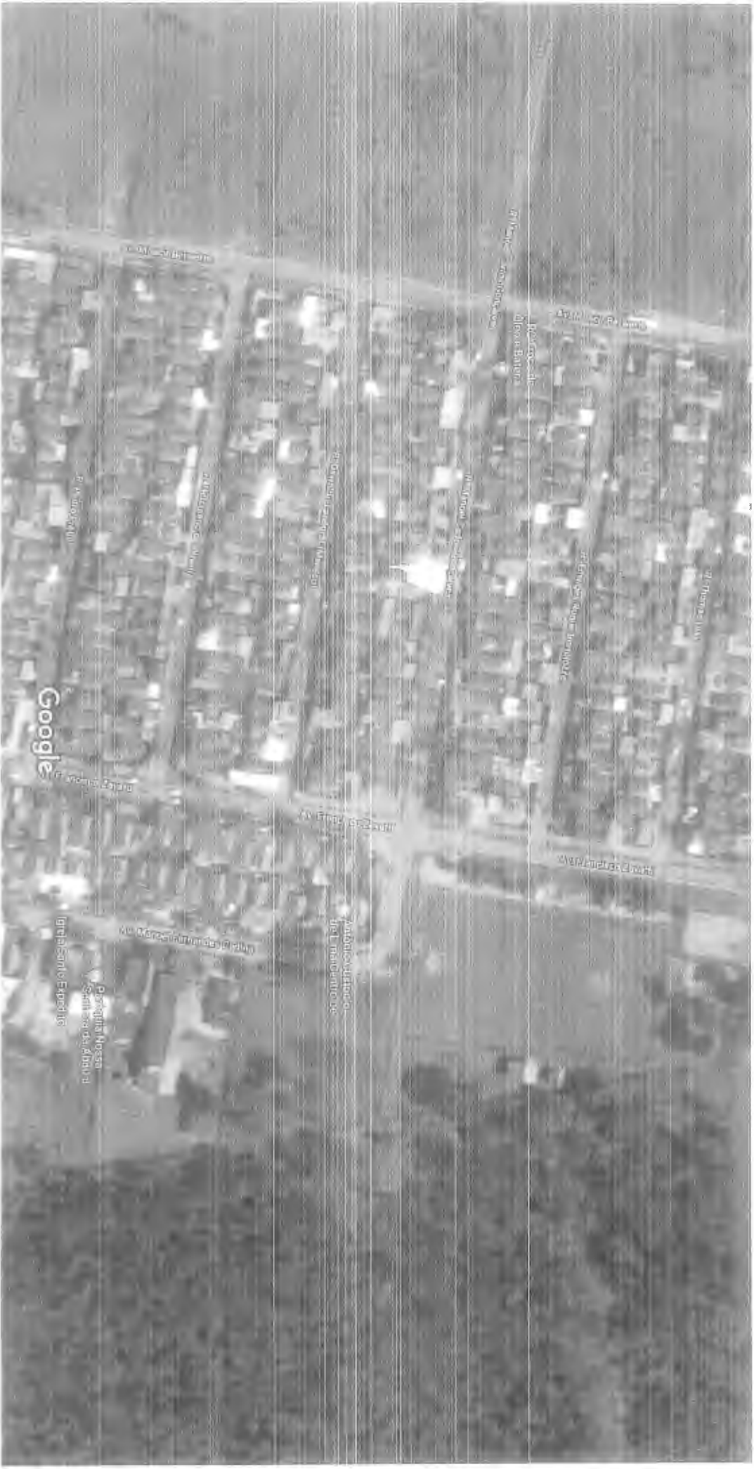
Imagens ©2018 DigitalGlobe, Dados do mapa ©2018 Google 20 m