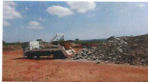
Caminhão realizando o descarte de entulho trazidos dos PEVs para ATT DAAE Pinheirinho/2017.