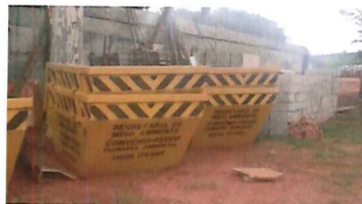
Caçambas acondicionadas na Estação de Tratamento de Resíduos Sólidos/2017.