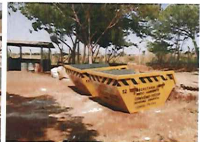
Caçambas estacionadas no PEV Jardim São Gabriel e Igaçaba/2017.