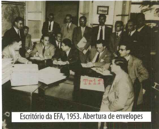
Escritório da EFA, 1953. Abertura de envelopes