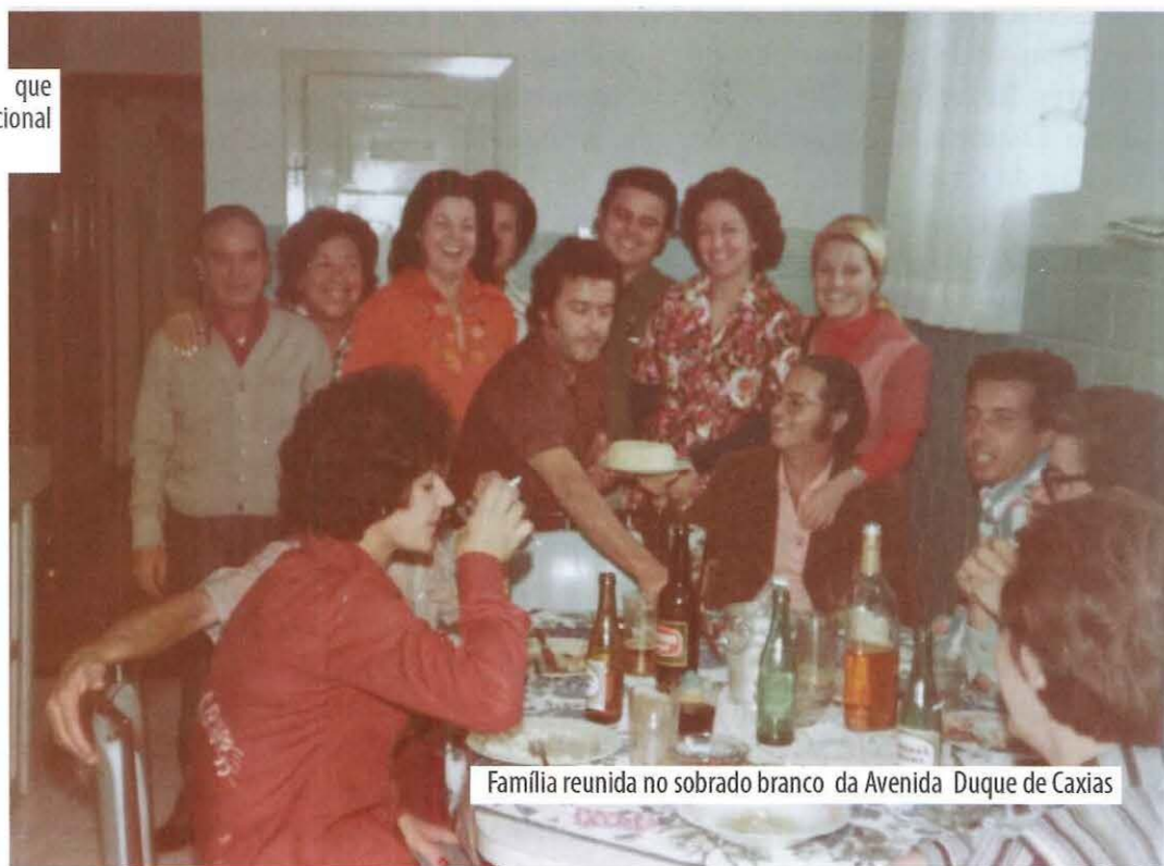
Família reunida no sobrado branco da Avenida Duque de Caxias