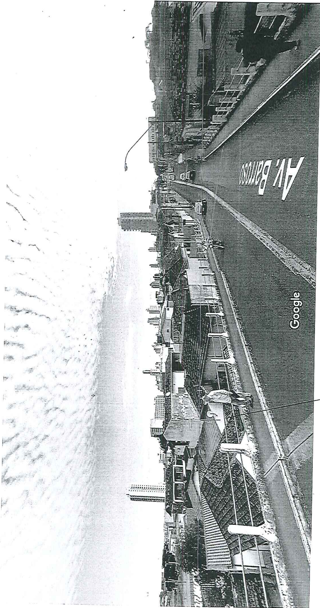
Captura da imagem: abr 2016