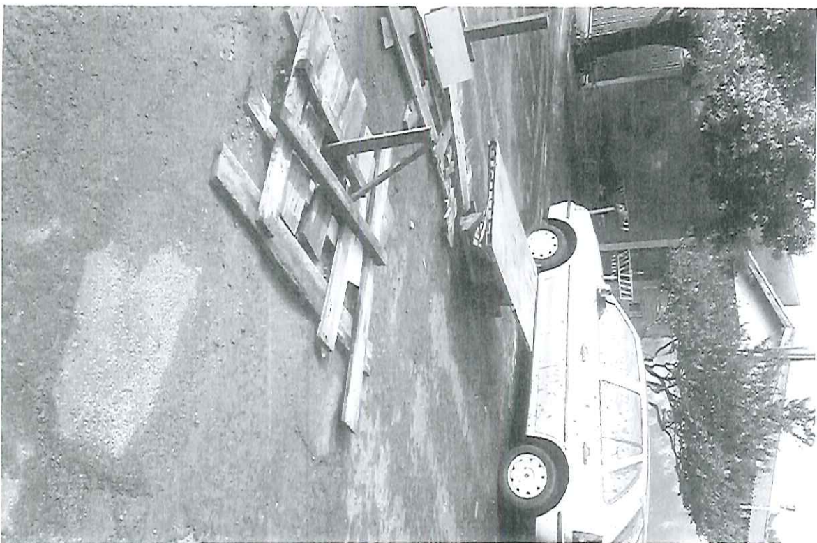
2 - 06.03 - Tapa buraco Rua Antônio Margonari - Jardim do Bosque.