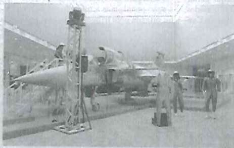
A réplica do caça Gripen NG está no Ribeirão Shopping

Quem tiver interesse, pode ainda entrar no cockpit e se sentir como um verdadeiro piloto de caça. O ingresso para visitar o cockpit é um quilo de alimento não perecível que deve ser trocado no local do