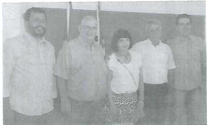
Centro de Ressocialização de Araraquara recebeu o evento