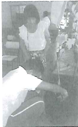
Ressocializando participa do projeto 'Natureza e Literatura'